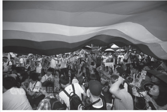
「紐約時報」25日在評論文章中指出，如果解法通過將成為法律，台灣將是亞洲同性婚姻的先鋒，並指出，目前仍有大多數的反對同性婚姻團體發起社會抗議運動，台灣社會尚無共識。

(記者黃兆新紐約25日電)「紐約時報」今天在評論文章中指出，如果相關法案通過成為法律，台灣將是亞洲同性婚姻的先鋒，並指出，目前仍有大多數的反對同性婚姻團體發起社會抗議運動，台灣社會尚無共識。