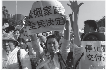
立法院26日將文書局高層會議中審議的民法72條修正草案, 下一代母權被撤出立法院外先會, 藍白高喊「停止審議、交付公決」等口號聲浪立響。民眾舉牌要求儘速立法, 記者侯家昇攝 105年12月26日

(記者許倚儀台北26日電)立法院司法及法制委員會26日上午審議婚姻平權法案, 挺同、反對團體集場外表達訴求。立法院初審通過民法親屬編部分條文修正動議, 異性或同性婚姻當事人適用夫妻權利義務的規定, 全案讓朝野議員、立法院朝野黨團都表示, 不會干預、阻撓, 但就完成初審, 應三讀還有最後的擔憂。