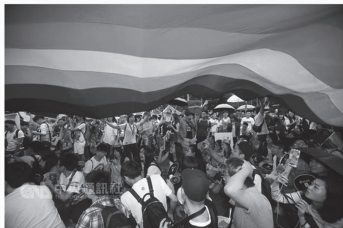
「紐約時報」25日在評論文章中指出，如果相關法案通過成為法律，台灣將是亞洲同志先鋒。圖為由「國際新聞社」主辦的同志遊行，並邀請總統馬英九出席參加。

(記者黃兆新台北25日電)「紐約時報」今天在評論文章中指出，如果相關法案通過成為法律，台灣將是亞洲同志先鋒的紀錄。並指出，目前仍有許多反對同性婚姻團體發起社會抗議運動，台灣社會尚無共識。