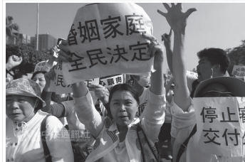
立法院26日再次審查同性婚姻條例草案的送972修正草案，下一代團體26日在立法院外集會，要求高喊「停止審查、交付公投，等」口號。圖為高喊修正草案，要求高喊修正草案，記者黃家齊攝 1051127月26日

(記者許佳倫台北26日電)立法院司法及法制委員會26日上午審查婚姻平權法案，挺同、反對團體集會場外交建訴求。立法院初審通過後我黨編部分黨文修正動議，異性或同性婚姻當事人適用夫妻關係義務的規定，全案須經對庭辯論。立法院野黨團都表示，不會干預、阻撓，但就算完成初審，編三讀還有再長的路要走。