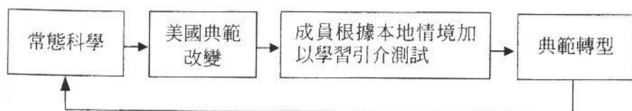
圖一：台灣傳播研究典範轉型的初探性模式