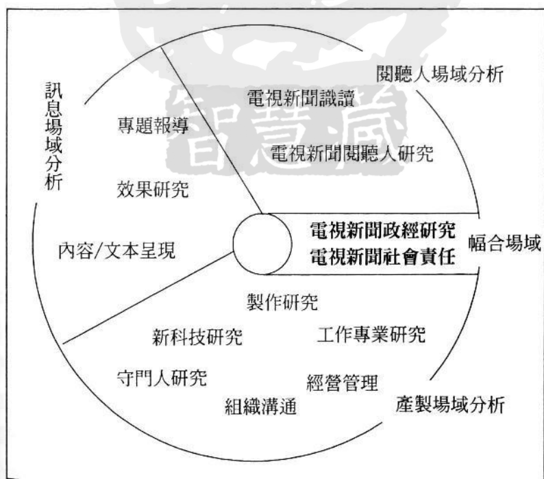
圖一：電視新聞研究場域

值得注意的是，這些研究場域的劃分主要是爲了便於闡釋電視新聞研究的知識基礎，彼此間並非互斥關係。例如研究電視新聞的訊息，不可能完全不去了解這類訊息的產製過程，只是研究的目的或者主要研究問題仍爲訊息本身，因此本文將之歸類於訊息場域的分析。又如效果研究事實上牽涉到訊息分析與閱聽人分析兩個研究場域。但是本文認爲，研究電視新聞對閱聽人產生的效果研究，強調的通常是電視新聞的某些訊息特色會對閱聽人產生因果式的影響（尤以負面影響爲主），閱聽人在此經常被簡約理解爲一同質的、被動的收視群體。爲了與本文所定義的閱聽人研究場域作一區隔，因此將之歸類於訊息研究場域。