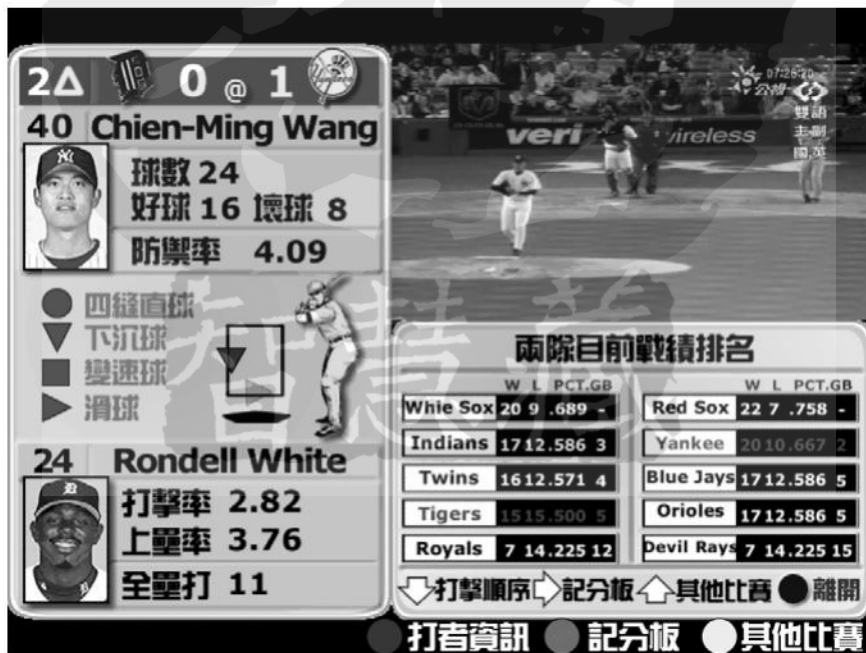
圖五說明：加值資訊部分可以分成兩個部分，左側固定顯示投打資訊以及投手投出的球種以及位置分析；右邊下側則透過操作可轉換打者資訊、計分版、其他比賽目前賽況、兩隊戰績排名以及打擊順序表等，圖中顯示為兩隊戰績排名。

另外，在此加值介面正式測試之前，先經過了3位使用者的測試，目的是找出明顯的設計錯誤，以減少正式進行測試時因設計錯誤(並非介面使用性不良)而導致的研究誤差。並在修正過後才進入正式的測試過程。